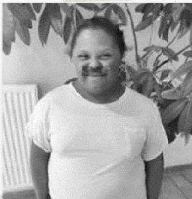
Avec la moustache !