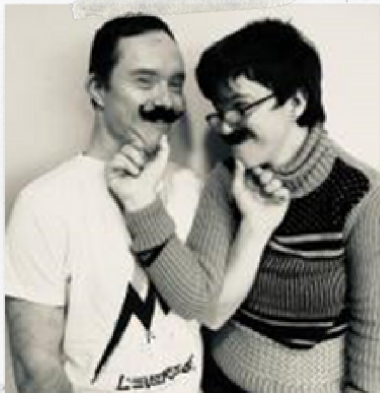
Tous les Résidents...